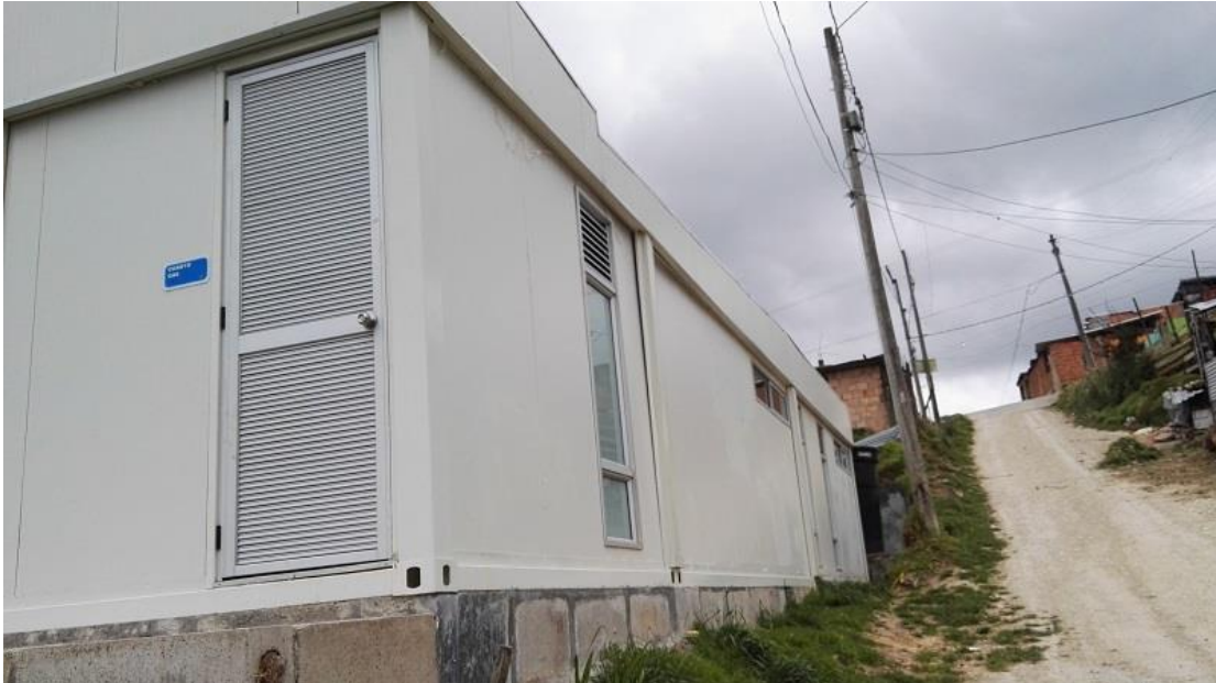
La Flora II, Las flores - Usme

“Por un control fiscal efectivo y transparente”