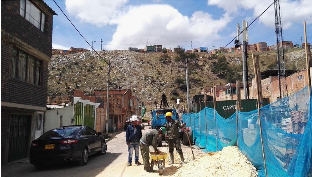
San Francisco Millán - Ciudad Bolívar

“Por un control fiscal efectivo y transparente”