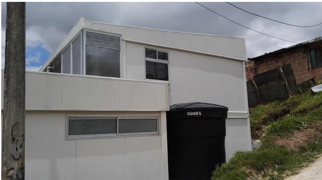
La Flora II, Las flores - Usme