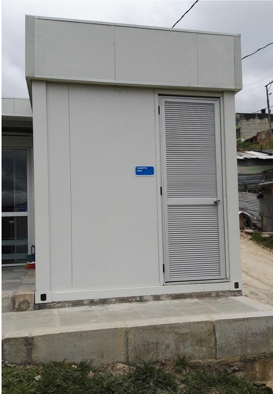
La Flora II, Las flores - Usme

“Por un control fiscal efectivo y transparente”