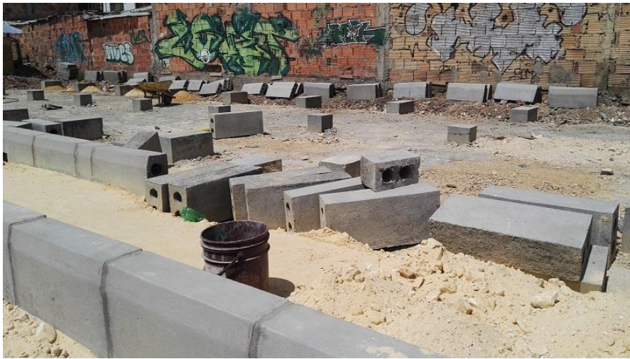
San Francisco Millán - Ciudad Bolívar

para nivelación de terrenos y conexiones de acueducto y alcantarillado o las adecuaciones de espacio público (andenes y/o vías afectadas).