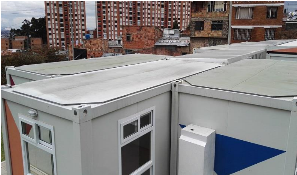
El Sosiego – San Cristóbal