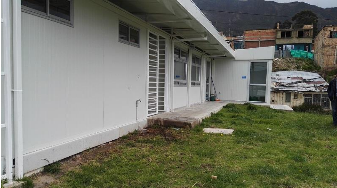
La Flora II, Las flores - Usme

las estructuras ante el llamativo y propenso uso de elementos metálicos; dotaciones de dichos establecimientos, pipetas expuestas al contacto con la calle, apropiación fraudulenta de agua, o el secuestro de menores como agravante principal.