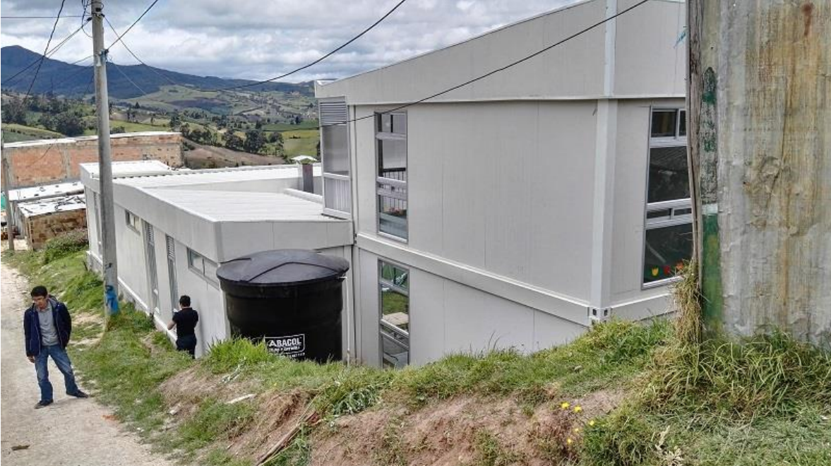
La Flora II, Las flores - Usme

“Por un control fiscal efectivo y transparente”