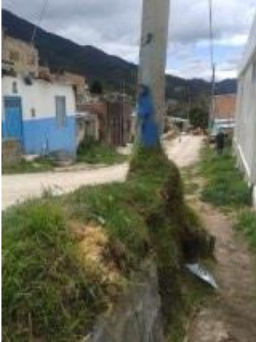
La Flora II, Las flores - Usme

“Por un control fiscal efectivo y transparente”