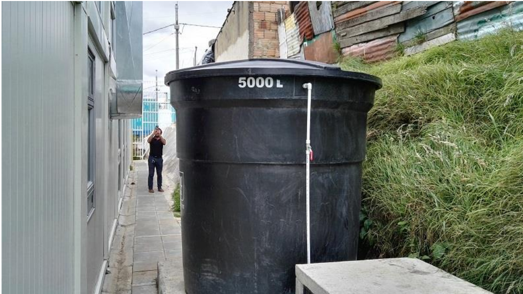
La Flora I - Casa de Integración familiar - Usme

sobre las estructuras no convencionales como se logró observar en Usme en los jardines de la flora.