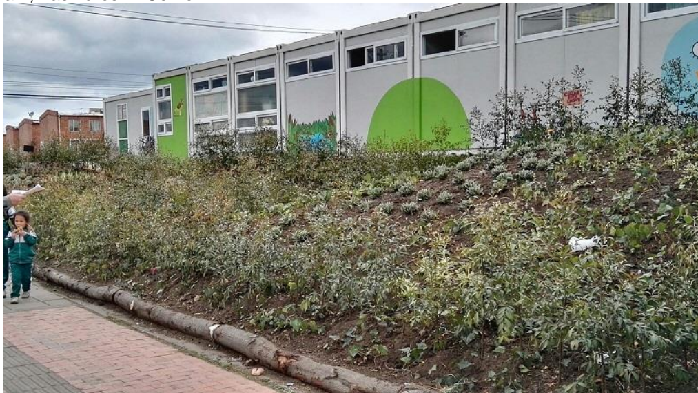
Los Pinos (doradito laguneros) - Suba