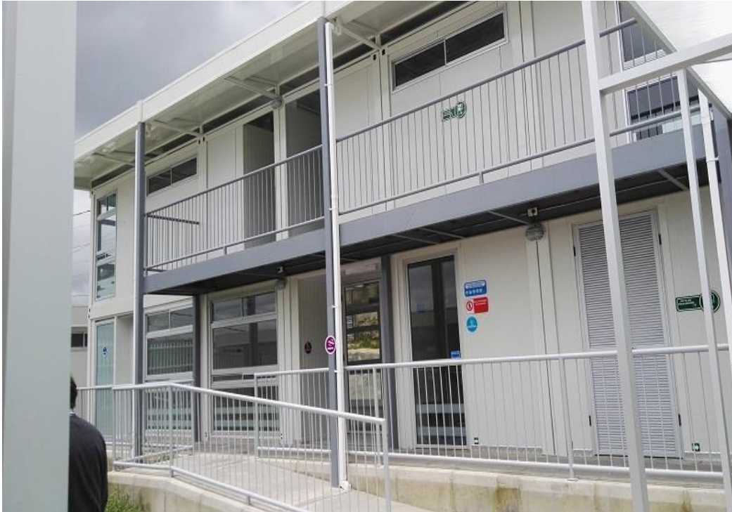
La Flora I - Casa de Integración familiar - Usme

“Por un control fiscal efectivo y transparente”