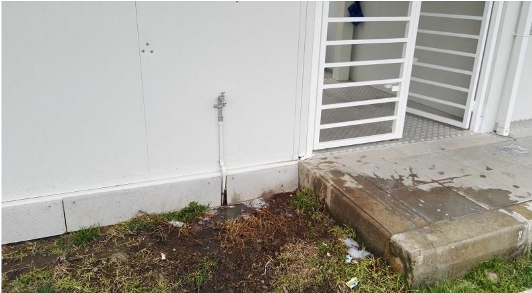
La Flora II, Las flores - Usme

“Por un control fiscal efectivo y transparente”