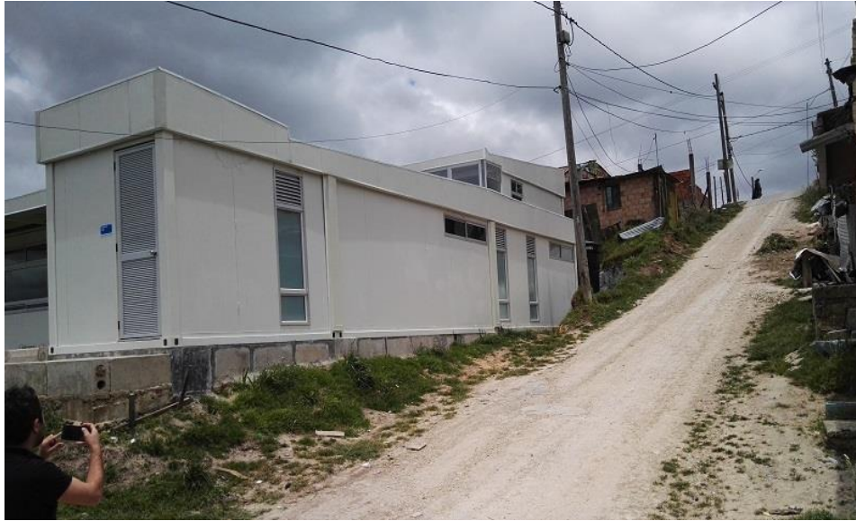
La Flora II, Las flores - Usme

“Por un control fiscal efectivo y transparente”