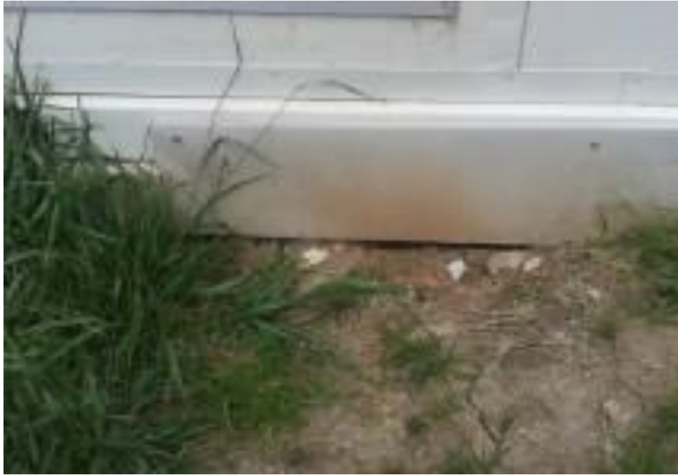
La Flora II, Las flores - Usme

“Por un control fiscal efectivo y transparente”