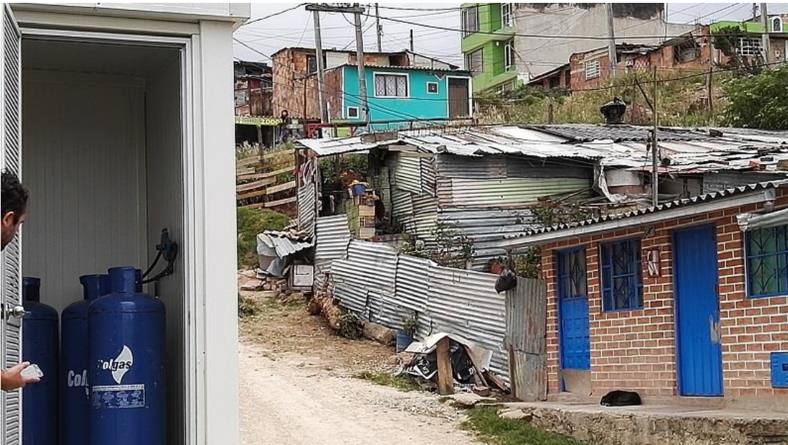
La Flora II, Las flores - Usme

En las visitas de campo efectuadas, es evidente el riesgo en relación con estructuras aledañas o colindantes que pueden generar algún tipo de derrumbe o deslizamiento