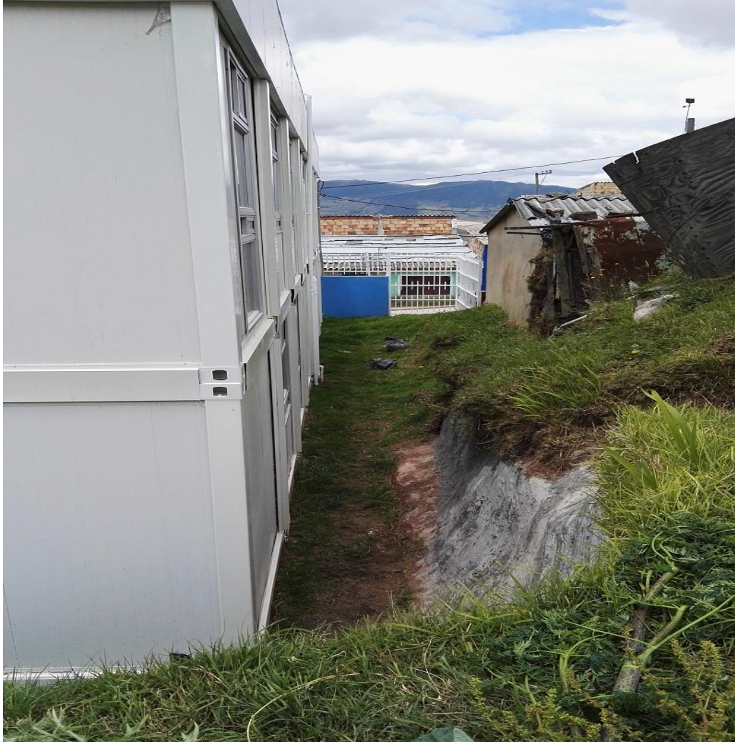
La Flora II, Las flores - Usme

“Por un control fiscal efectivo y transparente”