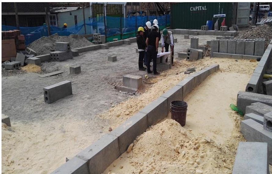
San Francisco Millán - Ciudad Bolívar